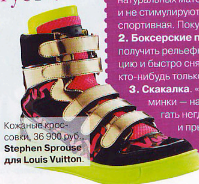
Кожаные кроссовки, 36 900 руб., Stephen Sprouse для Louis Vuitton.

бокса, сгонять жир с боков, балансируя на босу, — с Алексом не соскучишься. Тяжело? Да, зато в награду финальная растяжка руками самого тренера: лежи и получай удовольствие. «Я был в шоке, когда узнал, что в московских спортклубах клиенты растягиваются сами!» — взлетают вверх густые брови гуру. Да уж, сам себе позвоночник не вправишь, а этот профи не только мастерски растянёт мышцы, но и со спиной поможет.